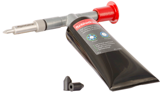
Die Aufsatzmundstücke können Sie unter Artikelnummer #117778 nachbestellen.

Bitte beachten Sie bei der Benutzung der Syntace GreaseGun auch die Bedienungs- und Benutzungsanleitung des zur Verwendung kommenden Schmierstoffherstellers.