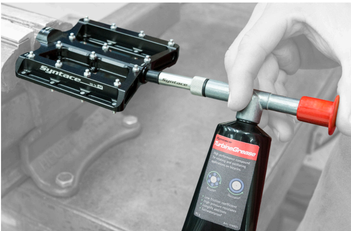
Anwendungsbeispiel mit Aufsatzmundstück an einem NumberNine Titan Pedal

TIPP: Sollten doch einmal verschiedene Fettsorten mit nur einer Syntace GreaseGun verwendet werden, muss unbedingt die Syntace GreaseGun gespült werden. Ansonsten vermischt sich das noch in der Fettpresse befindende Fett mit dem in der Tube. Zum Spülen der Fettpresse einfach die andere Fett-Tube aufschrauben und so lange die Fettpresse betätigen bis das alte Fett aus der Fettspritze gespült ist und das neue Fett aus der Spitze der Fettspritze strömt.